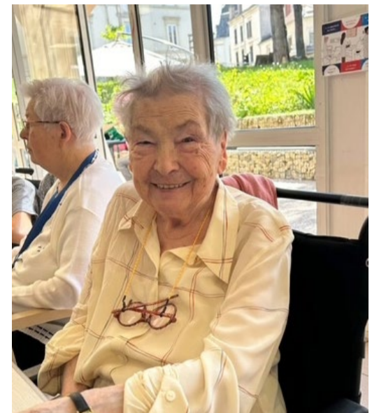
Mme Cointet notre doyenne, en pleine forme