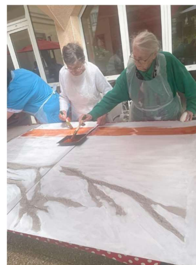
Préparation 2 ème tranche de panneaux pour le 2 ème étage

Quelle que soit leur forme, ces échanges sont toujours excellents pour le développement cognitif et émotionnel de tous.