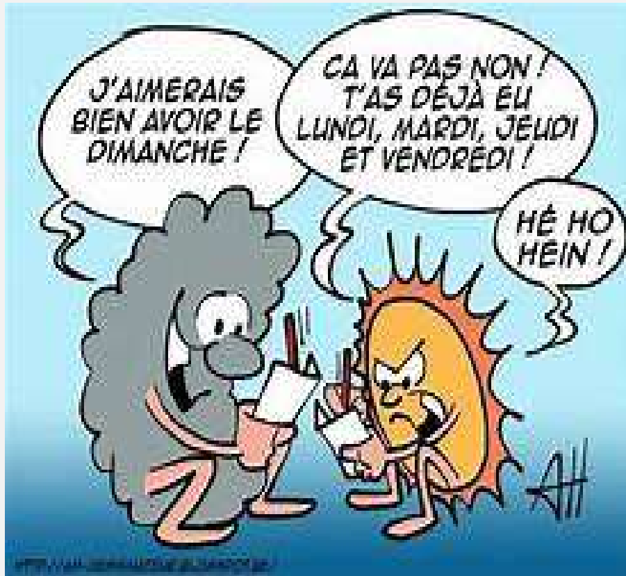
Il est mort le soleil ! en 2024 (NICOLETTA) ...